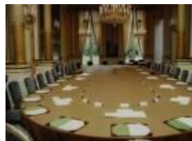
salle de réunion à l'Elysée

Le gouvernement se réunira demain avec le Président au palais de l'Elysée. (l'Elysée = le palais présidentiel)